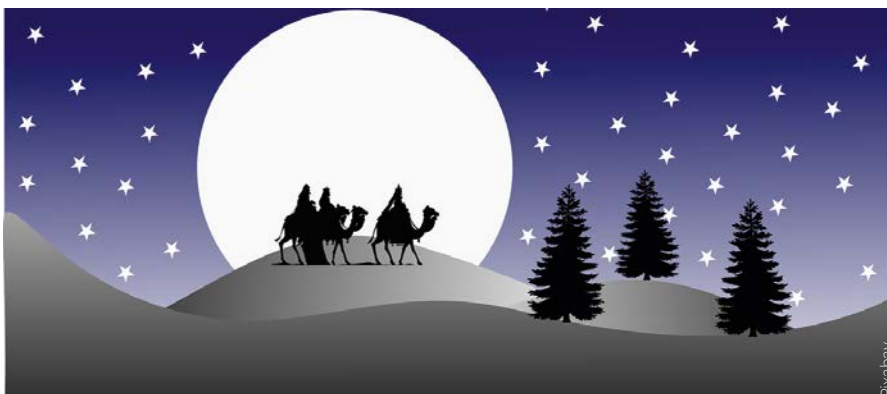
Motivbild der Heiligen Drei Könige

Auf ganz ungewöhnlichen Wegen kommt zu Euch heuer der Segen. Wir grüßen trotz allem wie jedes Jahr: „Behüte euch Gott!“, Eure Sternsingerschar. (Daniela Dicker)