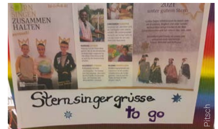
Sternsingergrüsse to go

Am 23. Dezember 2020 feierte ich mit jeder Klasse der VS Lannach einen individuell gestalteten Weihnachtsgottesdienst. Es war für mich eine schöne Erfahrung im Klassenverband zu feiern, aber auch eine Herausforderung, sich immer wieder neu auf eine Klasse einzustellen, um auf das Weihnachtsfest vorzubereiten.