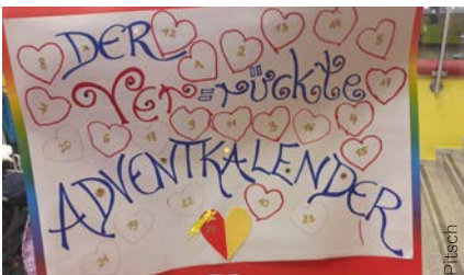
Der Ver-rückte Adventkalender

Eine Kollegin in der VS Lannach stellte 24 Lichtgläser für den Adventweg her. Maria und Josef wanderten von einem Lichtglas zum anderen und der Stall von Bethlehem stand am Ende des Adventweges. Die Kinder der VS Lannach unterstützten dabei, Maria und Josef ins rechte Licht zu rücken. Die Pausenhalle blieb bis Schulbeginn dunkel, so konnten die Kinder entdecken, wie viele Lichter schon auf dem Weg nach Bethlehem leuchteten.