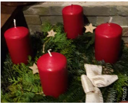
Adventkranz in der Schule

Mit einer Adventkranzsegnung stimmten wir uns auf die Zeit vor Weihnachten ein. Auf Grund der Corona-Maßnahmen wurde nur im Klassenverband gefeiert. Aber gerade dieser kleine Kreis war ein besonders schöner Rahmen, um die Adventkranzsegnung feierlich zu gestalten.